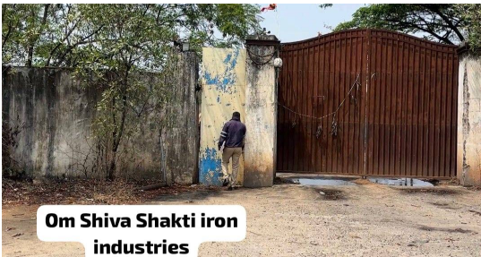
Om Shiva Shakti iron industries