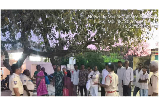
భద్రంగా ఉండాలని సూచించారు. అంతేకాక సీసీ కెమెరాలను ఏర్పాటు చేసుకొని గ్రామాలలో వివిధ రాజకీయ పార్టీల నాయకులు శాంతి భద్రతలకు సహకరించాలని ఒక సీసీ కెమెరా 100 మంది పోలీసులతో సమానం కాబట్టి గ్రామాలలో ప్రధాన రహదారులలో కెమెరాలను ఏర్పాటు చేసుకునే విధంగా ప్రజా ప్రతినిధులు ముందుగా రావాలని మీ గ్రామం మీ భవిష్యత్తు అనే నిబంధనతో గ్రామాల అభివృద్ధిలోపాటు శాంతిభద్రతల్లో విషయంలో గ్రామ ప్రజలు సురక్షితంగా జీవించడానికి అన్ని రాజకీయ పార్టీల నాయకులు పాల్గొలుకు అతీతంగా సీసీ కెమెరాల ఏర్పాటుకు సహకరించాలని సూచించారు.

సైబర్ క్రైమ్ నేరాల పట్ల కూడా జాగ్రత్త వహించాలని మీ యొక్క వివరాలను ఇతరులకు చెప్పకుండా ఉండాలని అనుమానం వస్తే పోలీసులకు సమాచారం అందించాలని ఈ సందర్భంగా సైబర్ క్రైమ్ నేరాల ద్వారా ప్రజలు నష్టపోతున్న వివరాలను వివరంగా క్లుప్తంగా ప్రజలకు ఎస్సై జయన్న వివరించారు. ముఖ్యంగా ఈ వేసవి కాలంలో దొంగతనాల కాలం వచ్చింది కాబట్టి వేసవికాలంలో దొంగతనాలు దోపిడీలు జరిగే ప్రమాదం ఉందని అందుకోసం ప్రజలు గ్రామీణ ప్రాంతాలలో ఎండ వేడిపాకి తట్టుకోలేక ఇంట్లో నిద్రించకుండా ఆరుబయట నిద్రపోవడం వల్ల దొంగలు దొంగతనాలకు పాల్పడే ప్రమాదం ఉందని తమ తమ ఇళ్లకు తాళాలు వేసుకొని విలువైన వస్తువులు ధరించకుండా రాత్రి వేళలో నిద్రించాలని ప్రజలకు సూచించారు. వగలు రాత్రి తేడా లేకుండా దొంగలు ఎండకాలం లో దొంగతనాలు చేసే అవకాశాలు ఎక్కువ ఉంటూ యుని ఈ ఎండకాలంలో దొంగతనాలను నివారించడానికి గుర్తు తెలియని వ్యక్తులు కనిపిస్తే పోలీసులకు సమాచారం అందించాలని ఆయన వివరించారు. అత్యుక్తులు మండలం పరిధిలోని వివిధ గ్రామాలలో అత్యుక్తులు మండల కేంద్రంలో పోలీసులు ముమ్మరంగా ప్రిటోలింగ్ నిర్వహిస్తున్నారని ప్రజలు భయభ్రాంతులకు గురికాకుండా