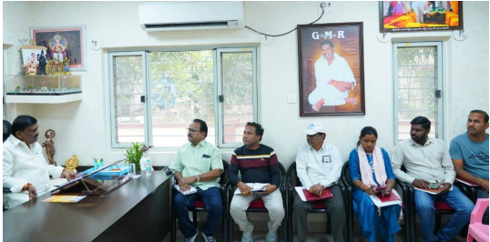
మాట్లాడుతూ.. అమీన్పూర్ సర్కిల్ పరిధిలో గల బీరంగూడ, అమీన్పూర్, రామచంద్రవరం, భారతి నగర్, బొల్లారం వార్డుల పరిధిలో గల ప్రతి కాలనీలో పారిశుధ్య నిబ్బందిని కేటాయించి.. ప్రతిరోజు పర్యటిస్తామని కోరారు. సిబ్బంది ఎదుర్కొంటున్న సమస్యలను సైతం తెలుసుకోవాలని సూచించారు. నూతన కాలనీలకు సరిపడి సిబ్బంది లేకపోతే నూతన సిబ్బందిని నియమించాలని సూచించారు. అతి త్వరలో సి ఎస్ ఆర్ నిధుల ద్వారా పారిశుధ్య వాహనాలను సైతం కేటాయించబోతున్నట్లు తెలిపారు. నియోజకవర్గ పరిధిలోని ఐదు మున్సిపాలిటీలకు ప్రత్యేకంగా 15 కోట్ల రూపాయల చొప్పున నిధులు కేటాయించడం