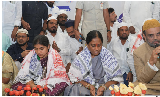
రాష్ట్ర ముఖ్యమంత్రి ముస్లిం సోదరులను అన్ని రంగాల్లో రాజీంచడానికి ప్రత్యేక కార్యచరణ రూపొందించారని, ముఖ్యంగా పలు రంగాల్లో ప్రతిభ చాచిన యువతి యువకులకు ఉద్యోగ అవకాశాలు కల్పించడం జరుగుతుందని తెలిపారు. ముస్లిం మహిళలు అన్ని రంగాల్లో రాజీంచడానికి ప్రత్యేక ప్రణాళిక సిద్ధం చేసుకుని రాష్ట్ర ప్రభుత్వం ముందుకు పోతుందని, ప్రభుత్వం కలిపిస్తున్న అవకాశాలను అన్ని వర్గాల ముస్లింలు సద్వినియోగం చేసుకోవాలని కోరారు. ముస్లింలకు

వరంగల్, ప్రతినిధి మార్చి 18 (వార్త నిర్ణయం ) రంజాన్ మాసంలో నిర్వహించే ఇష్టార్ విందులు మతసామరస్యానికి ప్రతీకలు అని రాష్ట్ర మంత్రి కొండా సురేఖ తెలిపారు. రంజాన్ పండుగను పురస్కరించుకొని వరంగల్ ఎల్ఐసీ నగర్ లోని ఏ వన్ క్లబ్ కన్వెన్షన్ హాల్ లో మాజీ ఎమ్మెల్యే కొండా మురళీధర్ రావు, రాష్ట్ర మంత్రి కొండా సురేఖ ఏర్పాటు చేసిన ఇష్టార్ విందు కార్యక్రమంలో ముస్లిం సోదరులతో కలిసి ప్రత్యేక ప్రార్థనలు నిర్వహించి పాల్గొన్నారు. ఉపవాస దీక్షలతో ఉన్న ముస్లిం సోదరులకు ఫలహారాలు తినిపించారు. అనంతరం మంత్రి సురేఖ మాట్లాడుతూ ఇష్టార్ విందులో పాల్గొనడం ఎంతో సంతోషంగా ఉందన్నారు. రంజాన్ మాస విశిష్టతను కొనియాడారు అన్ని మతాలను చెప్పేది ఒకటేనని మనస్ఫులంగా సోదరా భావంతో ఉండాలని చెప్పారు. ముస్లిం సోదర సోదరీమణులకు రంజాన్ శుభాకాంక్షలు తెలిపారు.