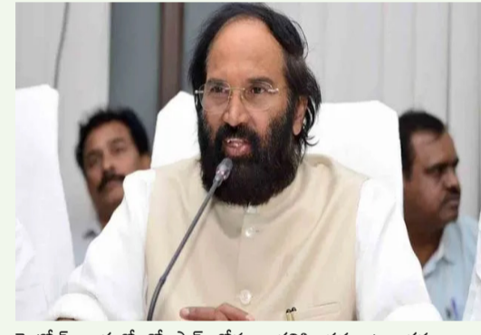
పెట్రోల్ బంకుల్లో నో స్టాక్ బోర్డులు కనిపించడం ట్యాంకర్లు ఇంకా చేరుకోవడంవల్లే, నిజమైన కొరత కారణంగా కాదని ఉత్తమ కుమార్ రెడ్డి స్పష్టం చేశారు. చాలాచోట్ల ప్రజలు భయంతో ముందు జాగ్రత్త కోసమని క్యాన్సెల్, కంటియనర్లలో పెట్రోల్, డీజిల్ తీసుకొక్కడంపై మంత్రి స్పందించారు. ఇలా క్యాన్సెల్ తీసుకొక్కడం చట్టవిరుద్ధమని, అలా చేసినవారిపై చర్యలు తీసుకుంటామని హెచ్చరించారు. హైదరాబాద్ పరిధిలో 596 పెట్రోల్ బంకులు

హైదరాబాద్ లో మంగళవారం కొన్ని బంకులు పెట్రోల్ లేక మూసివేయడంతో జనం ఆందోళనకు గురయ్యారు. దీంతో సాయంత్రం నుంచి బంకుల ముందు క్యూ కట్టారు. ఉదయం నుంచి ఇదే పరిస్థితి కనిపించడం, దీనికి తోడు పలు బంకులు మూతపడినంతో ఉత్తమ స్పందించారు. 60 రోజులకు సరిహద్దు పెట్రోలు నిల్వలు ఉన్నాయి : తెలంగాణలో పెట్రోల్, డీజిల్, ఎల్పీజీ కొరత లేదని ఉత్తమ కుమార్ రెడ్డి స్పష్టం చేశారు. రాష్ట్రంలో వచ్చే 2 నెలలకు సరిహద్దు అందైన నిల్వలు అందుబాటులో ఉన్నాయని అన్నారు. ఈరోజు డిమాండ్ 17,246 కిలోలీటర్ల కాగా, 17,898 కిలోలీటర్లు సరఫరా చేయడం జరిగిందని తెలిపారు. సోషల్ మీడియాలో జరిగిన ప్రచారం కారణంగా డిమాండ్ 25 శాతం పెరిగినప్పటికీ, సరఫరా సగటుకు మించి 22 శాతం అధికంగా కొనసాగుతోందని, అదనంగా 16,000 కిలోలీటర్ల బఫర్ స్టాక్ సిద్ధం చేశామని, 1,200 అదనపు ట్యాంకర్లను రంగంలోకి దించామని పేర్కొన్నారు. ఏ బంకునూ మూసివేయడానికి అనుమతించం : కొన్ని