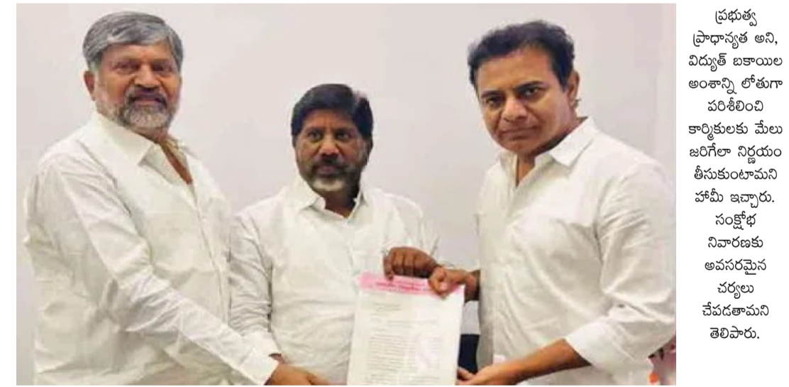
ప్రభుత్వ ప్రాధాన్యత అని, విద్యుత్ బకాయిల అంశాన్ని లోతగా పరిశీలించి కార్యకలకు మేలు జరిగేలా నిర్ణయం తీసుకుంటామని హామీ ఇచ్చారు. సంక్షోభ నివారణకు అవసరమైన చర్యలు చేపడతామని తెలిపారు.

సినిల్ల వస్త్ర పరిశ్రమను పట్టికీడిస్తున్న సంక్షోభం నుంచి నేతస్థలను గట్టిక్రొంచేందుకు బీఆర్ఎస్ వర్కింగ్ ప్రెసిడెంట్ కేటీఆర్ చొరవ తీసుకున్నారు. ఈరోజు సవివాహంలో డిప్యూటీ సీఎం భట్టి విక్రమార్కును కలిసిన ఆయన, సినిల్ల నియోజకవర్గంలోని పవర్ లూమ్ పరిశ్రమ ఎదుర్కొంటున్న ఆర్థిక ఇబ్బందులను వివరించారు. రాజకీయాలకు అతీతంగా జరిగిన ఈ భేటీ అందరినీ ఆకట్టుకుంటోంది. సినిల్ల వస్త్ర పరిశ్రమపై ఉన్న సమస్య రూ. 38 కోట్ల విద్యుత్ బకాయిలు, పేరుకుపోయిన బ్యాంక్ బిల్లింగ్, సర్వీసులను తక్షణమే మాఫీ చేయాలని కేటీఆర్ ఈ సందర్భంగా డిప్యూటీ సీఎం కోరారు. గత ప్రభుత్వ హయాంలో ఉన్న విధంగానే పరిశ్రమకు నిరంతర విద్యుత్ సబ్సిడీ ప్రయోజనాలు అందేలా చూడాలని, పాత బకాయిలతో సంబంధం లేకుండా నేతస్థలకు వెనులుబాటు కల్పించాలని విన్నవించారు. పరిశ్రమ సంక్షోభంలో ఉండటంతో నేతస్థల మళ్ళీ ఆత్మహత్యలు బాట పట్టే ప్రమాదం ఉందని, వారికి తక్షణమే భరోసా ఇవ్వాలన్న అవసరం ఉందని కేటీఆర్ తెలిపారు. కేటీఆర్ వివరించిన సమస్యలపై డిప్యూటీ సీఎం భట్టి విక్రమార్కు సానుకూలంగా స్పందించారు. నేతస్థల సంక్షేమం