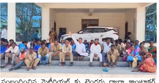
సంబంధించిన మెటీరియల్ కు టెండర్లు ద్వారా కాంట్రాక్టర్ లు మెటీరియల్ ఇస్తున్నారని. ఎలక్ట్రిఫైడ్ వర్క్ ప్రక్రియ చేపట్టడం జరుగుతుందని అదేవిధంగా మున్సిపల్ కార్మికులను ఎలక్ట్రికల్ వర్క్ సంబంధించి పనులు చేయాలని ఆదేశాలు జారీ చేసిన నేపథ్యంలో తాము ఆ పని చేయము ఈ పని చేయము అని మందలించారని అందుకే బయటకు వెళ్ళాల్సిందిగా సూచించినట్లు మున్సిపల్ కమిషనర్ లక్ష్యాల్లో అన్నారు. దుర్భాషలాడారు అని ప్రశ్నించగా ఎలాంటి దుర్భాషలాడలేదని అన్నారు. ఇతర మున్సిపాలిటీలో కూడా ఎలక్ట్రికల్ వర్కులు సంబంధించి బ్యాచులుగా ఏర్పడి పనులు చేస్తున్నారని జడ్పర్ల మున్సిపాలిటీలో విద్యార్థులుగా మేము అది చేయమని ఇది చేయము అని అనడం సరైన విధానం కాదని అధికారి చెప్పినప్పుడు విధులు తప్పకుండా నిర్వహించాల్సి వస్తుందని మున్సిపల్ కమిషనర్ లక్ష్యాల్లో ఆయన పేర్కొన్నారు.

జడ్పర్ల పట్టణంలో ఎలక్ట్రికల్ కు వర్క్ కు సంబంధించిన పనులు జరుగుతున్నావని ఈ నేపథ్యంలో ఎలక్ట్రికల్ కు