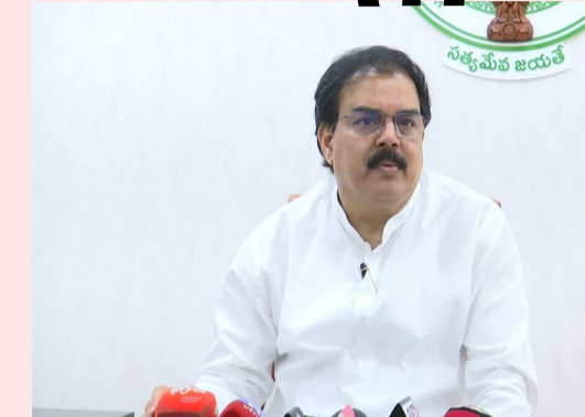
ఎక్కడా పెట్రోల్ , డీజిల్ కొరత లేదని మంత్రి స్పష్టం చేశారు 'సినిందర్ల ఖాతా మార్కెటింగ్ నివారణకు ప్రత్యేక తనిఖీలు నిర్వహిస్తున్నాం. ఇప్పటికే సినిందర్ల ఆక్రమాలుపై 800 కేసులు

5 లక్షల బుకింగ్స్ అవుతున్నాయని, సోషల్ మీడియాలో వచ్చే తప్పుడు వార్తలు నమ్ముద్దని ప్రజలకు సూచించారు. పైన్ట్ గ్యాస్ కనెక్టివిటీ: వాణిజ్య అవసరాలకు ఇచ్చే గ్యాస్ సరఫరాను కేంద్రం 10 నుంచి 20 శాతం పెంచినదని మంత్రి వెల్లడించారు. వాణిజ్య సినిందర్లు వాడేవారు అందోళన చెందాల్సిన అవసరం లేదన్నారు. రెస్టారెంట్లు, విద్యాసంస్థలకు సరఫరా పెంచేలా చర్యలు తీసుకుంటామని హామీ ఇచ్చారు. పట్టణాల్లోని ప్రజలు పైన్ట్ గ్యాస్ కోసం నమోదు చేసుకోవచ్చని తెలిపారు. రాష్ట్రంలో ఇప్పటికే 2.34 లక్షల మంది పైన్ట్ గ్యాస్ వినియోగించుకుంటున్నారన్న మంత్రి, పట్టణ ప్రాంతాలకు దీని కనెక్టివిటీ అందుబాటులో ఉందని పునరుద్ఘాటించారు. పట్టణాల్లో పైన్ట్ గ్యాస్ ఇంటింటికీ తరలించుకు వుంటున్న పైన్ట్ గ్యాస్ వేయాలని చెప్పారు. సోలార్, ఇండక్షన్ కుకింగ్ స్టాన్లను వినియోగించేలా చర్యలు తీసుకుంటామన్నారు. రాష్ట్రంలో