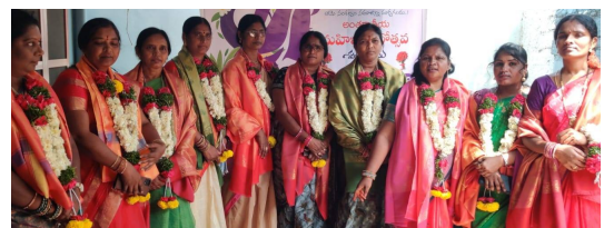
కలుగుతుందని, మాకు ఒక అన్న, లాగా ఒక తండ్రి లాగా చెప్పన్నా సీనియర్ అధికారి గుంటూరు మధ్య మేము చూడరుపూర్వక ధన్యవాదాలు తెలుపుతున్నాము.

సూర్యాపేట బ్యారో మార్చి 8 వార్డు నిర్వయం ఎన్ హెచ్ ఆర్ సి డిస్ట్రిక్ ప్రెసిడెంట్ మాట్లాడుతూ స్వతంత్రం వచ్చిన ఇన్ని రోజులైనా కూడా గాంధీ గారి కల్పలు ఎక్కడ నెరవేరరుతున్నాయి మహిళలకు, ఆదపిల్లలకు రక్షణ లేదు ఎవరైనా తప్పు చేస్తే వారిని ఉరితీయాలని ప్రభుత్వానికి తెలియజేస్తున్న మేము మహిళలము కాదు అది శక్తులమని ఒక మహిళా ఎప్పుడు నిర్వయం తీసుకుంటావో అప్పుడే మేము మహిళా దినోత్సవం జరుపుకుంటారు. మాకుంటూ ఒక గౌరవం ముందుండి మాకు ఈ శిక్షణ ద్వారా మీకు రక్షణ