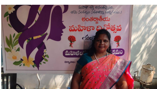
అంతర్జాతీయ మహిళా దినోత్సవం సందర్భంగా