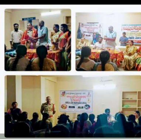
పదవతరగతి మరియు ఇంటర్మీడియట్ హాస్టల్ విద్యార్థినులకు జామెత్తీ బాక్స్, స్టేట్స్, పెన్స్ మొదలగు స్టేషనరీ పంపిణీ చేయడం జరిగింది.