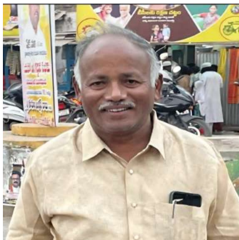
సౌకర్యాలు ఏర్పాటు చేయడమైంది అని అన్నారు. ఉమ్మడి తెలుగు రాష్ట్రాల తో పాటు మరియు దేశవ్యాప్తంగా ప్రజలు అధిక సంఖ్యలో పాల్గొని ఈ పట్టాభిషేక కార్యక్రమాన్ని జయప్రదం చేయాలన్నారు

మరాధిపతిగా పట్టాభిషేకం మహోత్సవ కార్యక్రమం. జరుగుతుందని బ్రహ్మాంగారి కాలజ్ఞానంల =పొందుపరిచి ఉన్నారు. స్వామి వారువ్రాసిన కాలజ్ఞానంలో నివిషయాలు ఇప్పటికీ చాలా జరుగుతూ ఉన్నవి భవిష్యత్తులో జరుగుతాయి అనేదానికి ఇది నిదర్శనం. అలాంటి మహనీయుని మరణం. మరాధిపతుల పట్టాభిషేక మహోత్సవానికి భక్తులెల్లరు పాల్గొని కార్యక్రమాన్ని వీక్షించి స్వామి వారి శీర్షప్రసాదాలు స్వీకరించాలని, పిలుపునిచ్చారు.హాజరైన భక్తులందరకీ. అన్ని