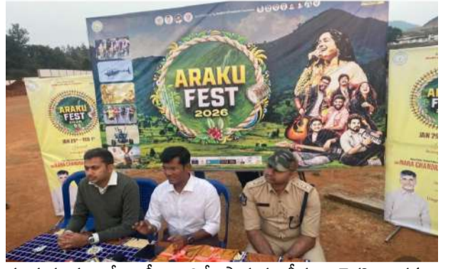
ఘుమఘుమలాడే కాఫీ, అదిరే సాహస క్రీడలు వెరసి అరకు ఉత్సవం ఒక మధుర జ్ఞాపకం. ఇంకెందుకు అలస్యం ఈ వారాంతంలో అరకులోయ ఇచ్చే ఈ మరుపురాని అనుభూతిని సొంతం చేసుకోండి!