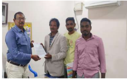
ప్రకటనలో తెలిపారు. అవినీతి అక్రమాలకు పాల్పడిన అధికారులు ప్రజా ప్రతినిధులు, వారి అనుయాయులపై శాఖాపరమైన, చట్టపరమైన కఠిన చర్యలు తీసుకోవాలని డిమాండ్ చేస్తున్నారు. విచారణ ఫలితాలపై ఆధారపడి తగిన చర్యలు తీసుకోవాలని ప్రజలు ఆశాభావం వ్యక్తం చేస్తున్నారు.

బాధ్యతారాహిత్యంగా వ్యవహరించారన్న విమర్శలు వ్యక్తమవుతున్నాయి. ఈ వ్యవహారంలో గ్రామ సర్పంచ్, ఎంపీటీసీతో పాటు వారి అనుయాయులు రాజ్యాంగేతర శక్తుల వ్యవహారిస్తూ ప్రజల మధ్య వర్గ వైషమ్యాలు సృష్టిస్తున్నారని స్థానికులు ఆరోపిస్తున్నారు. పంచాయితీ కార్యదర్శి, సర్పంచ్ కుమారుడు, ఎంపీటీసీ భర్త పాత్రపై కూడా విచారణ జరపాలని డిమాండ్ చేస్తున్నారు. ఈ నేపథ్యంలో, సదరు హెల్త్ వెల్ఫేర్ సెంటర్ నిర్మాణాన్ని తక్షణమే నిలిపివేయాలని, పంచాయితీ తీర్మానం, స్థల సేకరణ పత్రాలు, ప్రజల సమ్మతి వంటి అంశాలపై సమగ్ర విచారణ నిర్వహించాలని జిల్లా పంచాయితీ అధికారి, జిల్లా వైద్య, ఆరోగ్యశాఖ ఇన్చార్జి లకు ఫిర్యాదు చేసినట్లు ఎమ్మార్వీఎస్ నాయకులు బుధవారం